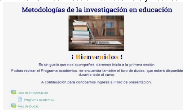
Figura 1. Entorno virtual Moodle. Actividad Foro y Recurso Archivo.

La experiencia de formación se llevó a cabo en el marco del Programa de Formación Docente de la Dirección General de Asuntos del Personal Académico de la UNAM que se alojó en el servidor de la Secretaría de Educación Médica de la Facultad de Medicina, UNAM. El curso en línea se desarrolló en el entorno virtual Moodle, en el que además de emplear las actividades y recursos propios de esta plataforma se utilizaron previa curación de contenidos artículos, y videos que se insertaron en libros, páginas y lecciones de Moodle, como se muestra a continuación. Figuras 1 a 4.