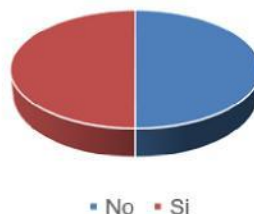
Gráfica 2. Antecedente de formación en investigación educativa