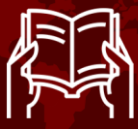
Figura 2. Lección en Moodle y Foro