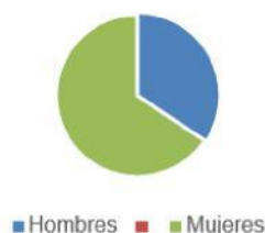
Gráfica 1. Docentes inscritos distribución por género